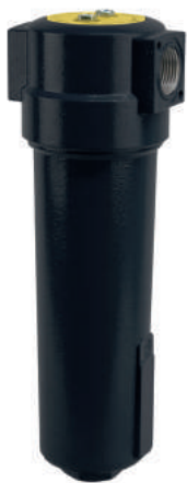
Сепаратор Airrus STH

В результате центробежных сил влага, содержащаяся в сжатом воздухе, набирает достаточный вес и соскальзывает на дно корпуса сепаратора. Далее конденсат и эмульсия выводятся в автоматическом режиме с помощью конденсатоотводчиков, либо вручную.