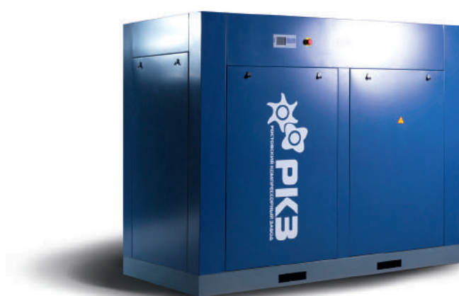
Airrus NB 75