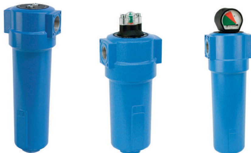
Фильтры Airrus FP