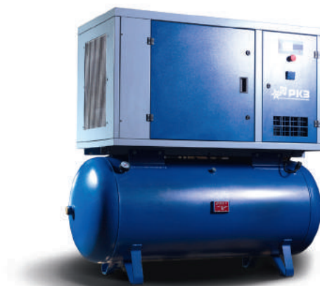
Airrus KT 15